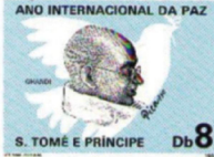
பிகரோ வரைந்து வெளியிட்ட தபால் பிரிஸ் வெளியிட்ட தபால்தலைமை.

இந்திய அழகை 45-க்கு மேற்பட்ட காந்திஜி உருவம் பெறிக்கப்பட்ட ஸ்டாம்புகளையும், 200-க்கு மேற்பட்ட சிறப்பு முத்திரைகளைக்கொண்ட தபால் உறைகளையும், அச்சுல் அட்டைகளையும் வெளியிட்டுருக்கிறது. போலந்து, காந்திஜிக்கு முதல் முதலில் அச்சுல் அட்டை (போஸ்ட் காடு) வெளியிட்டு கவரவட்டுத்தியது. முதல் முதலில் உருவத்துடன் கூடிய நினைவு உறை வெளியிட்டது, ருமேனியா நாடு. முதல்முதலில் காந்திஜி உருவத்துடன் கூடிய அச்சுல் முத்திரை உருவாக்கி, குத்தி பயன்படுத்திய நாடு, மியான்மர். அப்போது அந்தநாடுபாய் என்ற பெயரில் அழைக்கப்பட்டது.