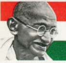
இங்கிலாந்து வெளியிட்ட காந்திஜியின் தபால்தலைமை.