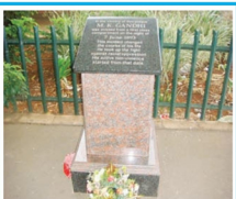
காந்திஜியை கீழே தள்ளியிருக்கும் தென்னாப்பிரிக்க அரசு அமைத்துள்ள நினைவிடம்.

இக்கிய நாட்டு சபை காந்திஜி பிறந்து அக்டோபர் 2-ந்தேதியை, 'எவ்வசை அகிம்சை தினமாக' அறிவித்து அவரது புகழ்க்கு மகுடம் சூட்டியது. இறுதிசன அறிவிப்பை 2007 ஐண்டு 15-ந்தேதி வெளியிட்டது. காந்திஜியின் 140-வது பிறந்து தினமான அக்டோபர்-2009ல், அவரது ஸ்டாம்பையும் வெளியிட்டு பெருமையப் படுத்தியது. அதில் இடம்பெற்ற காந்திஜியின் ஒலியைத் தலைப்பேடி பெற்ற ஒலியில் பெரியில் செச்சிபேசை வரைந்தார். அனைத்து வண்ணங்களையும் பயன்படுத்தி வரைப்பட்ட அபூர்வ ஒலியில் அதுவாகும்.