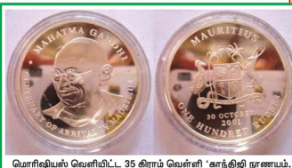
மொரிஷியஸ் வெளியிட்ட 35 கிராம் வெள்ளி 'காந்திஜி நாணயம்.'

மொரிஷியஸ் நாடு 2001-ல் 35 கிராம் என. சொன். காந்திஜியின் மானயத்தை வெளியிட்டது. ஒன்றுதாயிரம் மட்டுமே வடிவமைக்கப்பட்டதால் இதுவும் விலை மதிப்பற்றதாகிவிட்டது.