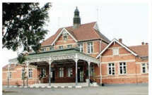
பீட்டர் பெரியில் வர்க்கிஸ் பெரியில் நிலவழி

கூசல் கேட்டு, டிக்கெட் பரிசேதான் வந்தார். அவரின் காந்திஜியை கடிக்காட்டி அவரை கீழே இறக்கியபோது வெள்ளையர்கள், காந்திஜியை, 'நான் முதல் வகுப்பில் பயணம் செய்ய டிக்கெட் வைத்திருக்கிறேன். அதனால் பயணம் செய்தேன். இறக்காமட்டேன்' என்றார்.