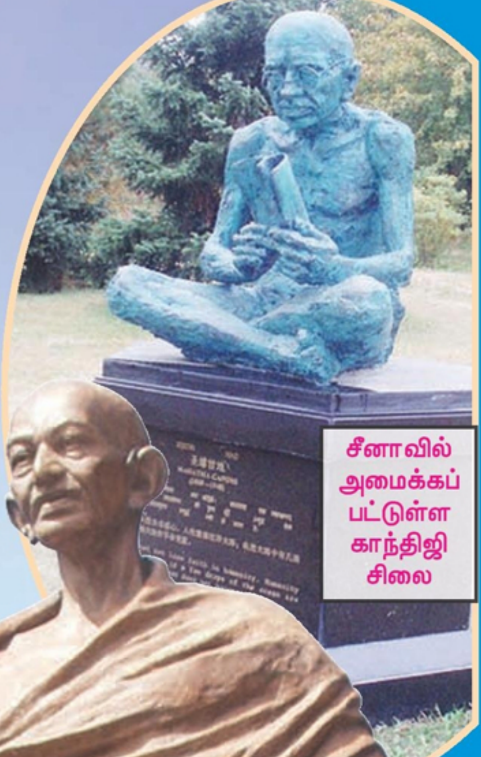
சீனாவில் அமைக்கப்பட்டுள்ள காந்திஜி சிலை