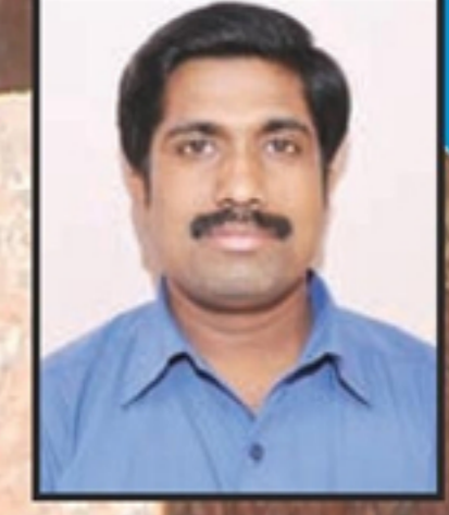
(சிலை படங்கள், தகவல்கள் தொகுப்பு: சும்மிடிப்பூண்டி எம்.எல்.ராஜேஷ்)

கம்யூனிஸ்ட்டு நாடுகளான சீனா, ரஷியா, கியூபாவிலும் காந்திஜிக்கு சிலைகளை நிறுவியுள்ளார்கள். ரஷியாவில் 3 இடங்களில் சிலை வைக்கப்பட்டிருக்கிறது.