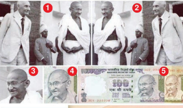
1. வில்லியம் பிரடெரிக் பெதிக் வாரன்ஸ் உடன் காந்திஜி திருக்கும் படம். 2. அப்படித்தான் கண்ணடி படம். 3, 4. இரண்டாம் படத்தில் உள்ள காந்திஜியின் உருவப்படம் தான் வெட்டி எடுக்கப்பட்ட ரூபாய் நோட்டுகளில் பயன்படுத்தப்படுகிறது.

நம் கையில் இருக்கும் எல்லா இந்திய காள்சி நோட்டுகளின் பின் பகுதியிலும் சரித்துப்ப காந்திஜி இடம் பெற்றிருக்கிறார். அந்த சரிப்புக்கு பின்னாலும் ஒரு சிறப்பு உண்டு. 1946-ம் ஆண்டு காந்திஜியை வில்லியம் பிரடெரிக் பெதிக் வாரன்ஸ் என்பவர்கள் சந்தித்தார். அவர் இந்தியா மற்றும் டீர்மாவிற்கு, இங்கிலாந்தின் செயலாளராக பணியாற்றுவார். காந்திஜியும், அவரும் சந்தித்தபோது காந்திஜியிடம் இருந்து அந்த ஆளான என்னைகை வெளியிட்டது. அதை போட்டோகிராபர் 'கிளிக்' செய்துவிட்டார். அதான முதல் படம். இரண்டாவது படம் அப்படி அதை 'ரிவால்' செய்தது. ரிவால் செய்தபோது படத்தில் இருந்து காந்திஜியிடம் பண்கை காட்சியை மட்டும் 'குரோபஸ்' செய்து, வெட்டி எடுத்து காள்சி நோட்டின் முன்பகுதியில் பரிசீலனை செய்துகொண்டிருக்கிறார்கள்.