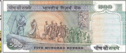
'கிபார்க் லூர்த்தி' சிலையும், அச்சிலையின் படம் பொறிக்கப்பட்ட 500 ரூபாய் தாளும்.